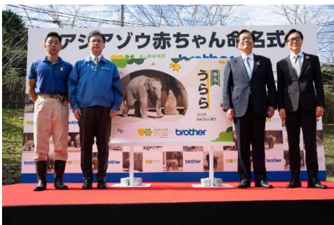
アジアゾウの赤ちゃんの命名式の様子