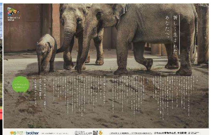
新聞広告の掲載内容