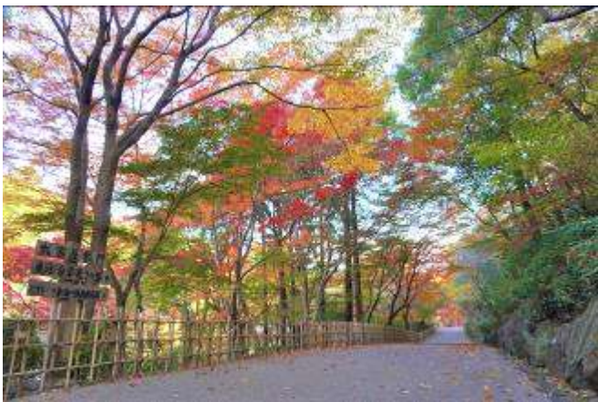
合掌線の五色もみじ