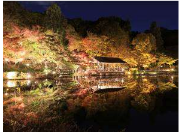
奥池の逆さもみじ