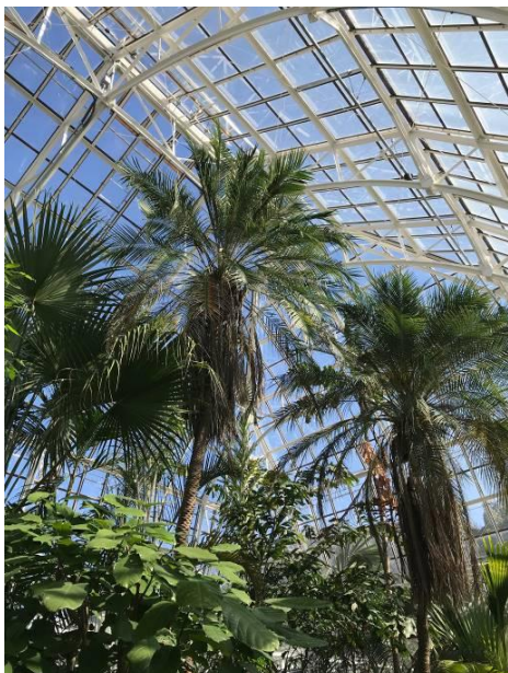
【開園当初から植えられているシンノウヤシ】