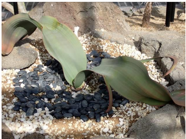
【珍しい植物の展示：キソウテンガイ】