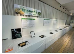
植物（ミドリ）のチカラ