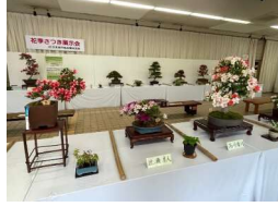
花季さつき展示会