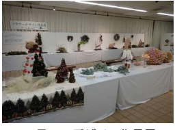
フラワーデザイン作品展