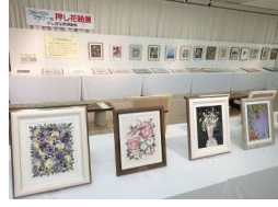
フルーツとフラワーの押し花絵展