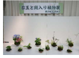
苔玉と斑入り植物展