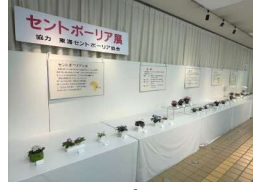
セントボーリア展