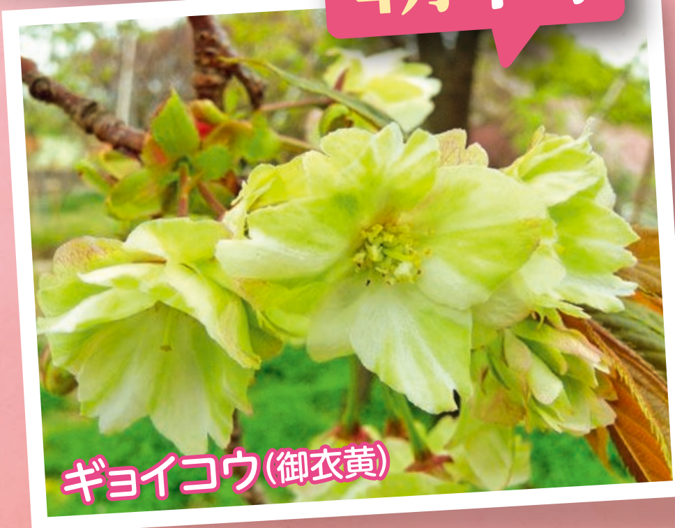
ギョイコウ(御衣黄)