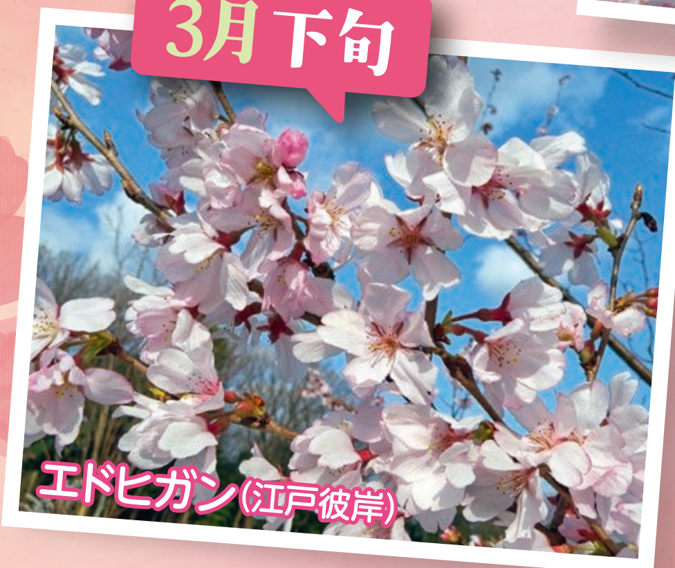
エドヒガン(江戸彼岸)