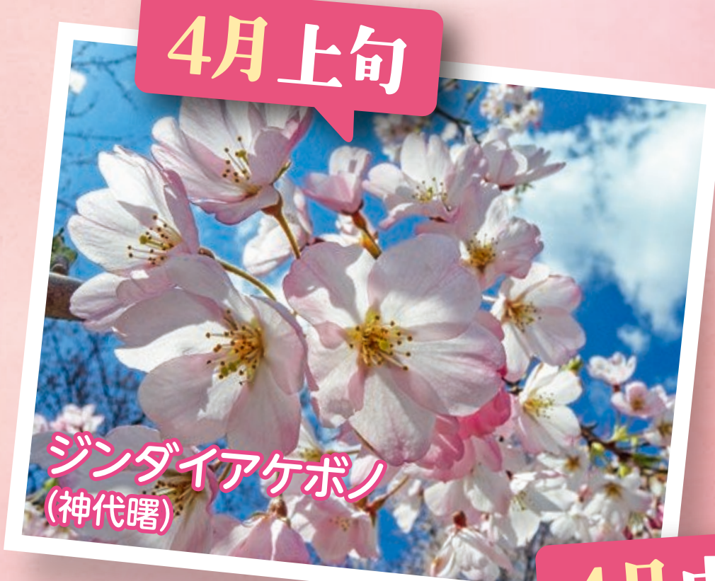
ジンダイアケボノ (神代曙)