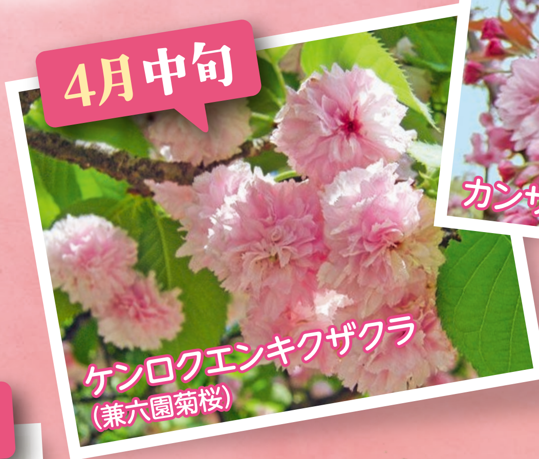
ケンロクエンキクザクラ (兼六園菊桜)