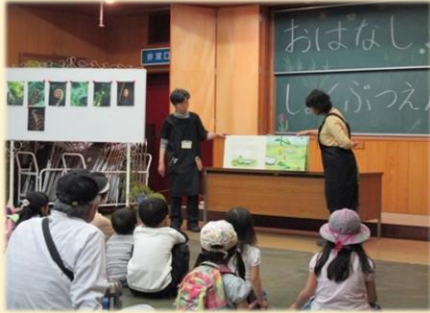
おはなししょくぶつえん