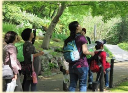
身近な自然を見つめよう(初夏編)