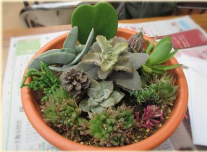
多肉植物で寄せ植えをつくろう