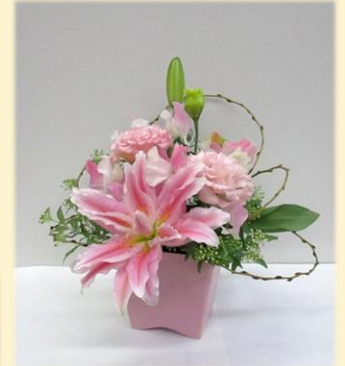
生花でつくるおひなさま飾り