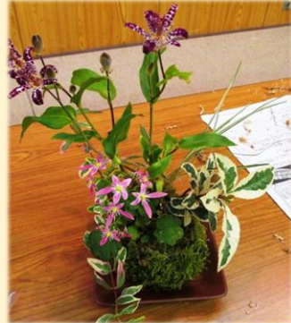
秋の山草を使った苔玉づくり