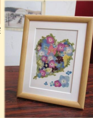
押し花のアレンジで部屋飾りをつくろう