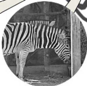
チャップマンシマウマ