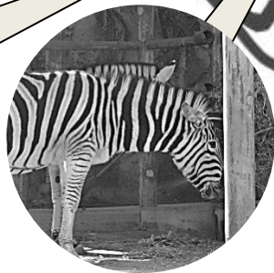
チャップマンシマウマ