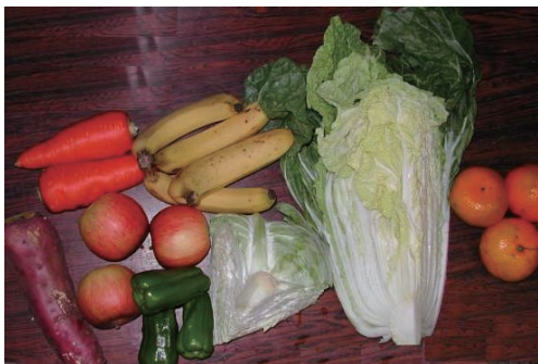
チンパンジー 1 頭あたりのエサの種類と量